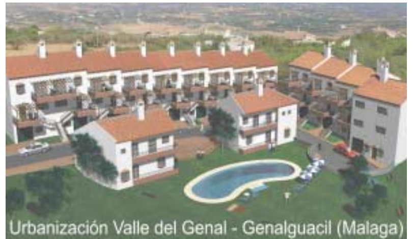
Urbanización Valle del Genal - Genalguacil (Malaga)