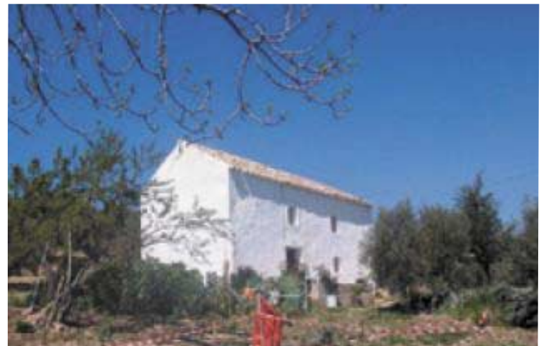
Villas, haciendas, viñedos y casas de campo rodeadas por maníficos paisajes de la Sierra de Ronda

Villas, mansions, farm houses, vineyards, and country houses surrounded for magnificents sceneries of Sierra of Ronda